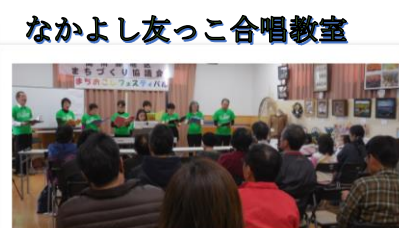
なかよし友っこ合唱教室