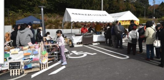
手芸品バザーと味噌焼きうどん