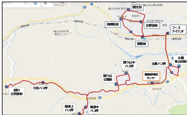
運行経路：関南部～関駅～まちなみ～関支所

したが、このたびの総会で新たに自 主運行バス協議会を設立する事が 承認されました。今後は自主運行バ ス協議会が中心となって、平成三十 年十二月の運行開始を目指して活 動を続けていきます。皆様の御協力 をお願い致します。