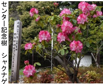
センター記念樹 シャクナゲ