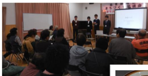
三重大生による医療クイズ