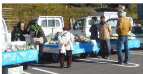
地域住民による野菜バザー

昨年12月、関南部地区コミュニティセンターで「手作り作品展」と「まちおこしフェスティバル」が同時開催されました。当日はたくさんの御来場ありがとうございました。